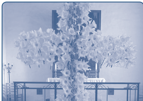
Glimt fra 'Ulvetime' i april, hvor børnene fra det smukke påskelilje-kors fik små trækors med hjem...