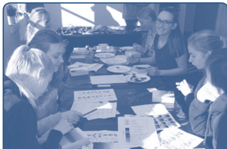
I foråret lavede konfirmanderne ikoner over deres konfirmationsord. Der blev arbejdet intenst, og ikonerne blev meget, meget flotte.