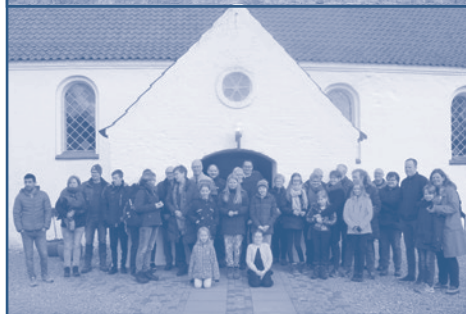
Anden Påskedag var vi en god flok, der efter andagt i Langelund Kirke vandrede til Ringive Kirke, hvor vi fejrede nadver sammen, inden vi spiste vores madpakker i konfirmandstuen. En herlig formiddag!