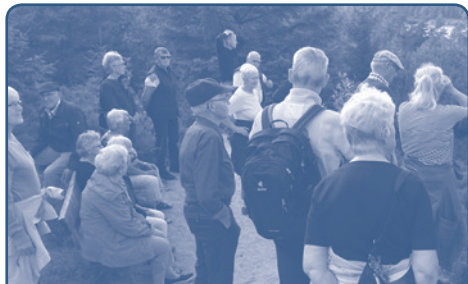
Fra sidste års sogneudflugt til Syvårssøerne.

Vel mødt til en forhåbentlig dejlig sommeraften.